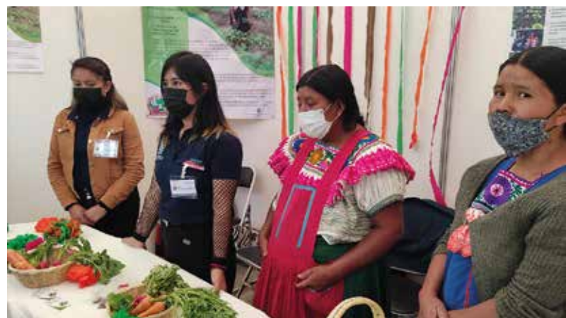
Con apoyo de: W.K. Kellogg Foundation.